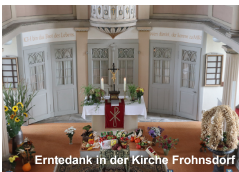
Erntedank in der Kirche Frohnsdorf