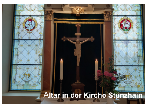
Altar in der Kirche Stünzhain