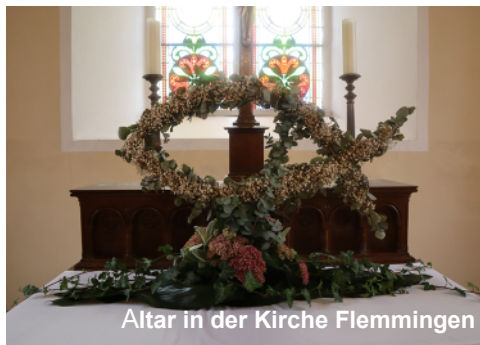
Altar in der Kirche Flemmingen