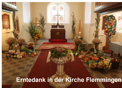
Erntedank in der Kirche Flemmingen