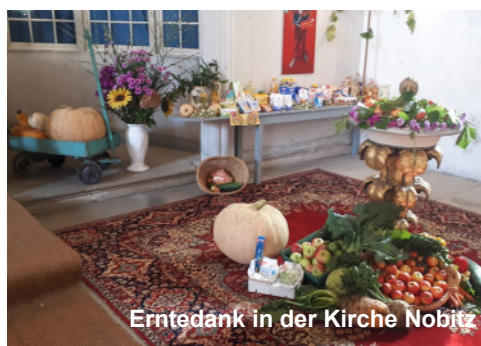
Erntedank in der Kirche Nobitz