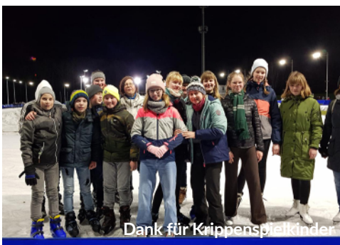
Dank für Krippenspielkinder