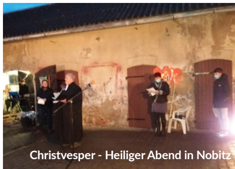
Christvesper - Heiliger Abend in Nobitz