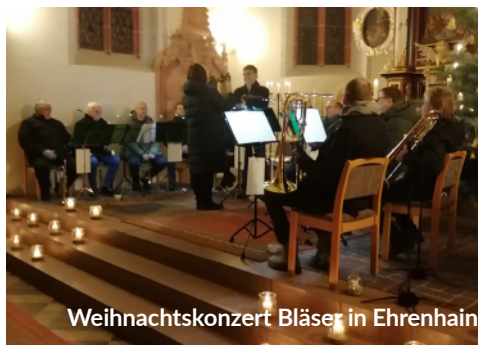
Weihnachtskonzert Bläser in Ehrenhain