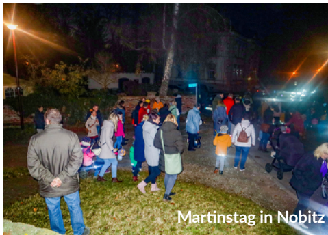
Martinstag in Nobitz