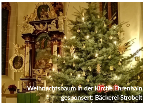
Weihnachtsbaum in der Kirche Ehrenhain gesponsert: Bäckerei Strobel