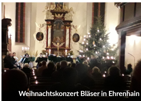
Weihnachtskonzert Bläser in Ehrenhain