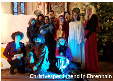
Christvesper Jugend in Ehrenhain